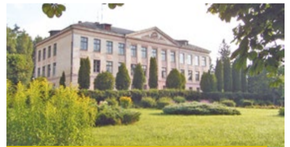
Līgatnes vidusskola, celta 1959. gadā.