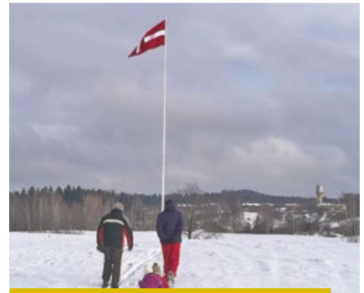
Lielais Latvijas karogs Kangarītī 2018. gada janvārī.

2021. gada 6. maijā Kangarītī, Pluču kalna nogāzē, sāka ▶