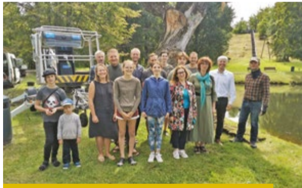
Vides objekta Zudušas mājas veidotāji.