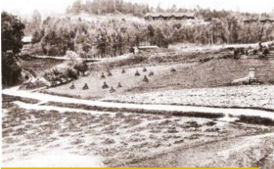
Skats no Gaujas ielas 8 uz Pluču kalnu 19. gs. beigās.