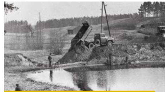
Liek caurteku Pluču kalna diķī. Ap 1955. gadu.