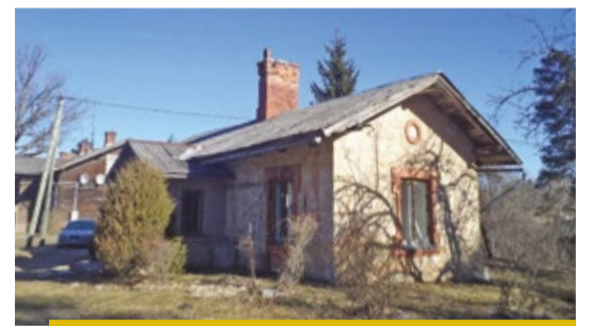
Pluču kalna brūzītis un Kalnu iela. 2017. gada 30. marts. Rasma Vanaga.