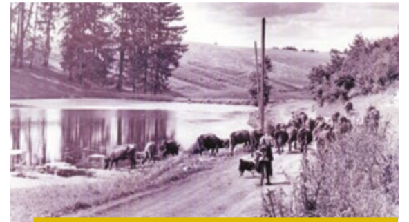
Līgatniešu govīs ceļā uz ganībām Kangarītī pie Pluču kalna diķa. 1950. gadi.