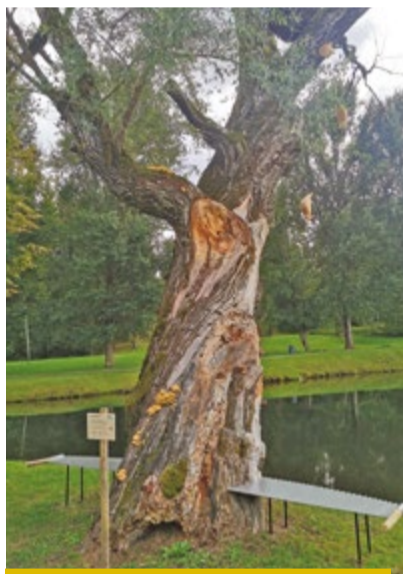
Vides objekts Zudušās mājas .