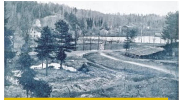
Strautu ielas sākums 19. gs. beigās.