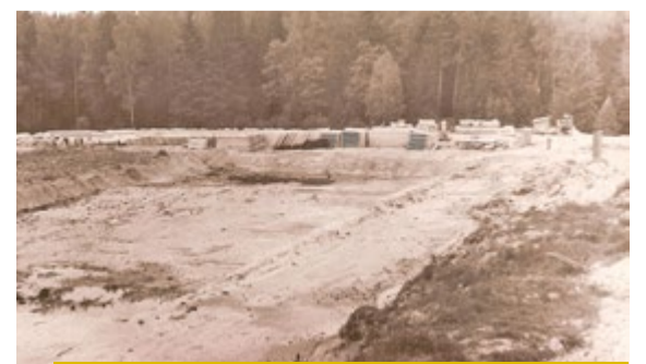
Attīrīšanas iekārtu celtniecība pie Kangariša. 20. gs. 80. gadi.