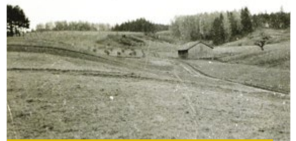
Šķūnis Dārza ielā pie dārzniecības. 1950. gadi. Līgatnes fotoarhīvs.