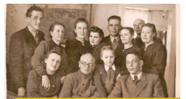
Ceipu ģimene ar draugiem Ceipu mājā. 1950. gadi.