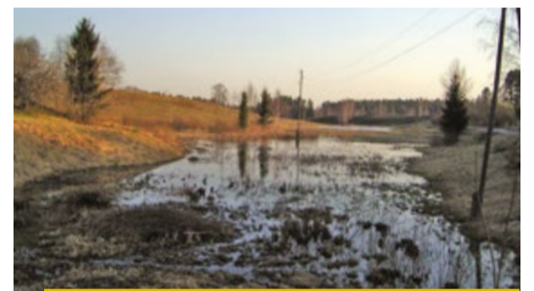
Pluču kalna diķī 2004. gadā. Līgatnes fotoarhīvs.