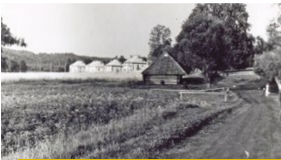
Dārza iela pie Gaujas ielas. 1950. gadi.