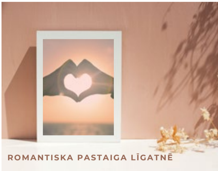
ROMANTISKA PASTAIGA LĪGATNĒ