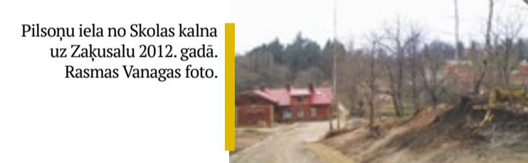
Pilsoņu iela no Skolas kalna uz Zaķusalu 2012. gadā.