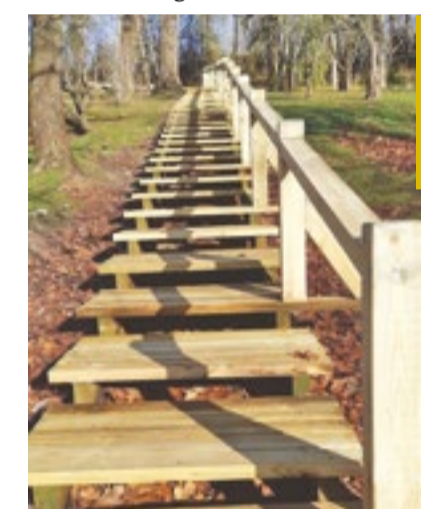
Jaunuzbūvētās kāpnes no kultūras nama uz skolas kalnu 2019. gada oktobrī.