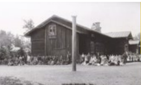
Līgatnes papīrfabrikas skola Skolas kalnā 20. gs. sākumā.