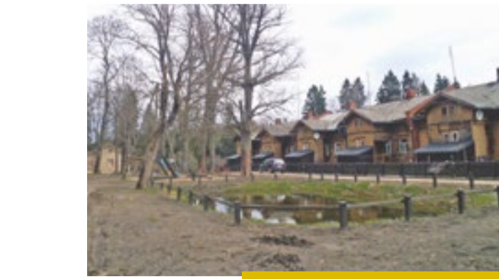
Māja Pilsone ielā 6 ar atjaunoto diķīti. 2012. gads.