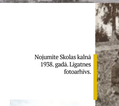
Nojumite Skolas kalnā 1938. gadā.