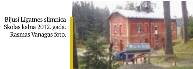
Bijusi Līgatnes slimnīca Skolas kalnā 2012. gadā.