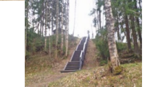
Skats no Skolas kalna uz Līgatnes papīrfabriku un Remdenkalnu 2012. gadā.