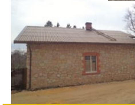
Atjaunotais brūzītis Skolas kalnā, kur cepa maizi. 2012. gads.