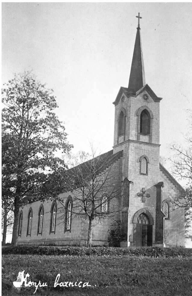
Jaunuzceltā Ķempju baznīca.

noticis. Jā, kur vienmēr piesiets stāvējis bullīts (vienkoča laiva), tās tur vairs nebijis. Arī viņkrastā tā nebijis. Bet ātrā straume pa upi nesa ledus blukus. Māti un visus bērnus atrada lejāk krūmainā ielīcī pie Zvārtes iezā.