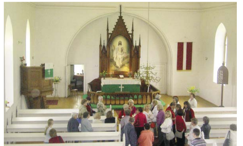
Ekskursanti Ķempju baznīcā 2012. gadā.

No vēstures materiāliem redzams, ka patreizējā Līgatnes novadā bijušas divas baptistu drau-