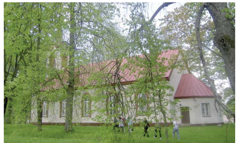
Ķempju baznīca 2008. gadā.