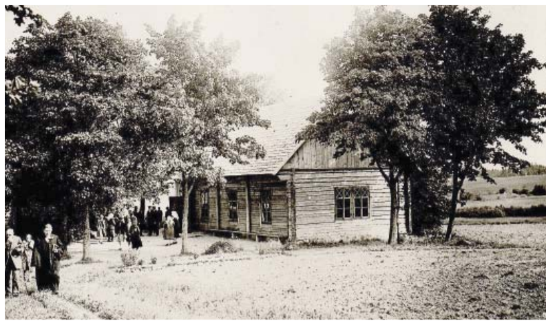
Slāņu lūgšanu nams 1926. gadā.