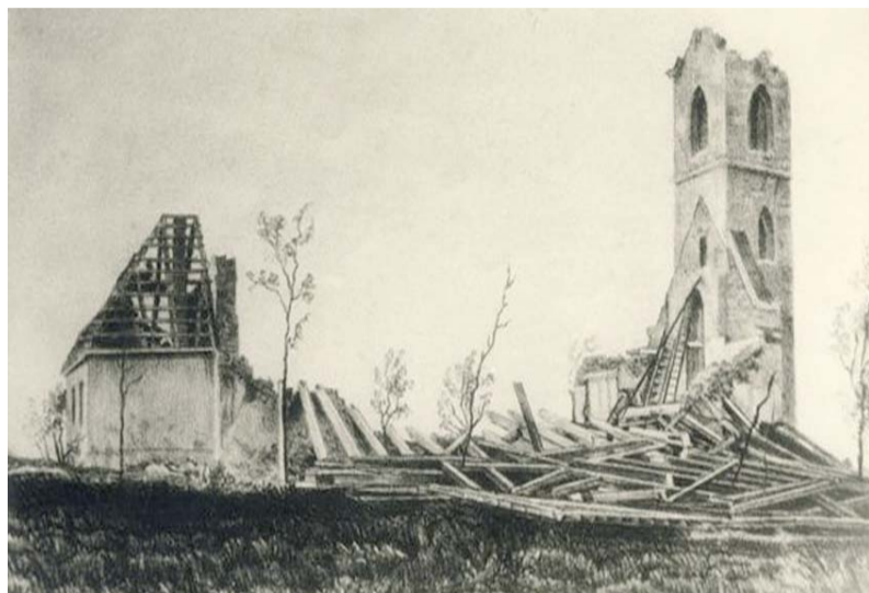
Lielais viesulis sagāzis Ķempju baznīcu 1872. gada 10. maijā.