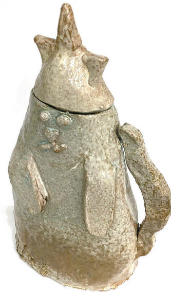
Daļa no vizuāli plastiskās mākslas programmas audzēkņu kolektīvā keramikas darba „Zemūdens dārgumu meklētāji”.

Līgatnes Mūzikas un mākslas skolas direktors