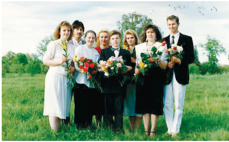
Līgatnes Mūzikas un mākslas skolas pirmais izlaidums 1994. gadā.