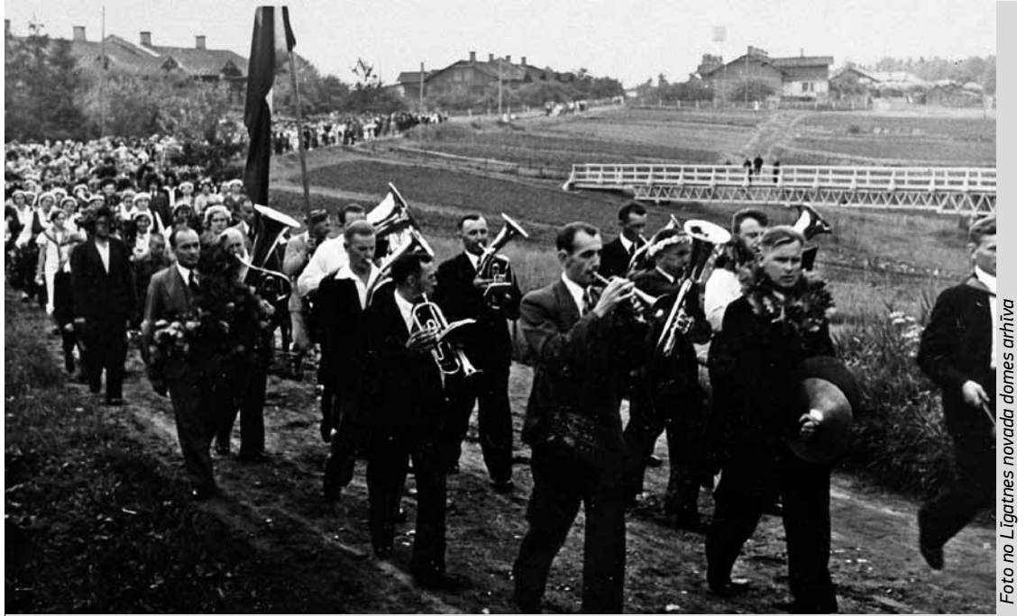
Līgatnes pūtēju orķestris, 30. gadi.

(4. turpinājums. Sākums LNZ, jūnijs, Nr.6; augusts, Nr. 7; septembris, Nr.8; oktobris, Nr. 9)