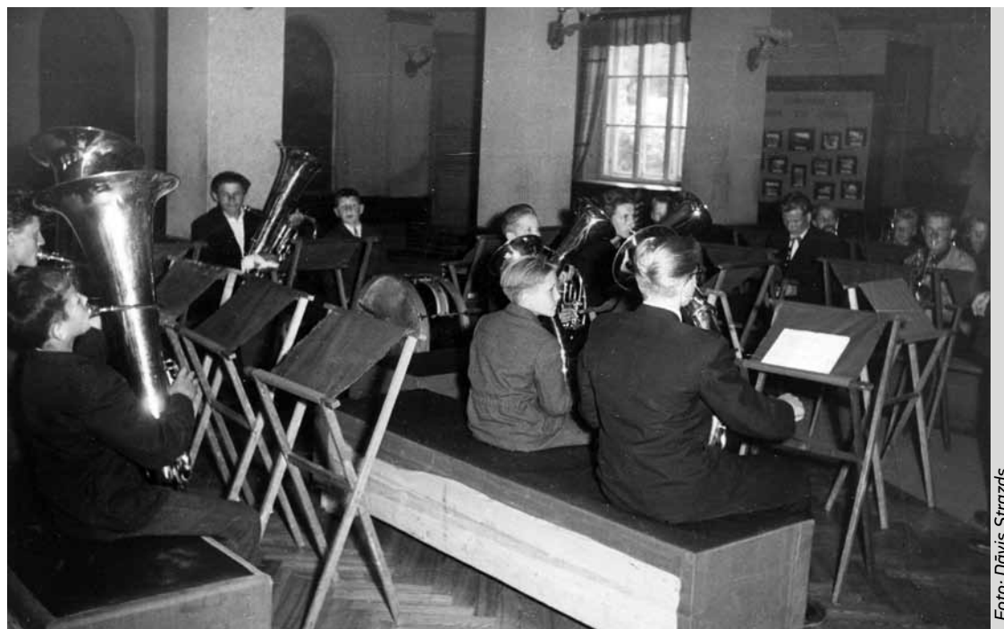
Līgatnes pūtēju orķestris ap 1958. gadu.

Atceros – vienu reizi nākam mēs no Sprīņu kapiem – kas nu tur daudz ko iet: no kalna lejā un klubā iekšā. Bet, ejot par kalnu lejā, redzams, ka slimnīcas dārzs sirdzēju pilns. Labs laiks, silts, pretī kapos kāds notikums, un strīpainās pīdžāmās ģērbtās būtnes sasē- ▷