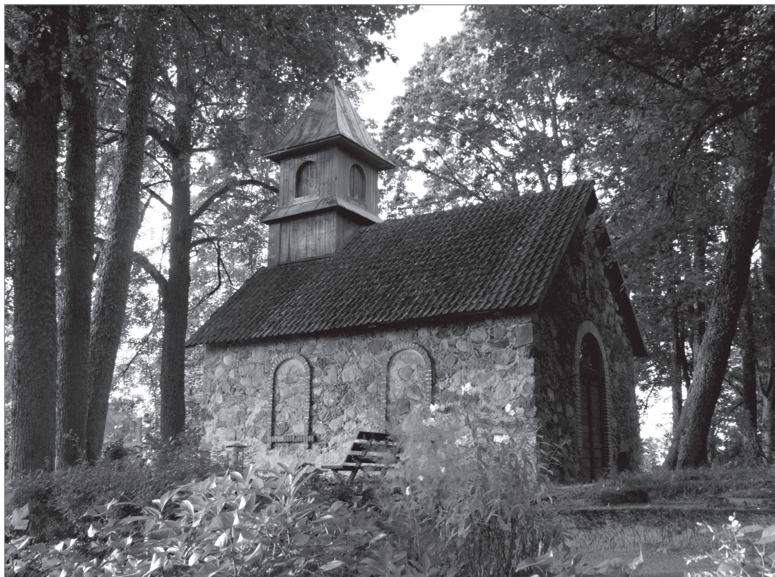
Ķempju kapu kapliča