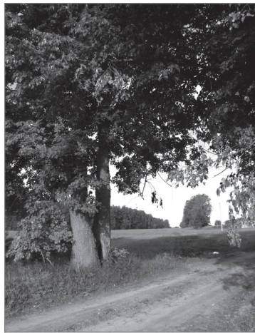
Liepa pie Veclečiem