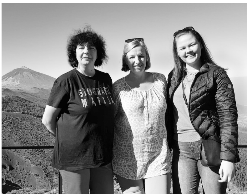
Līgatnes pedagoģes Teides vulkāna pakājē.

hidrotērpos. Tūristus no vietējiem iedzīvotājiem varēja viegli atšķirt pēc apģērba. Mēs noteikti nesejojām vietējo ģērbšanās tendencēm un izbaudījām sauli, vasaras