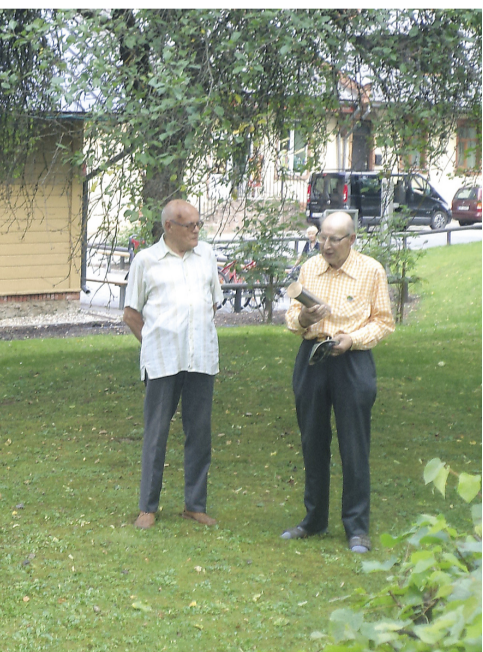
pldināšana Līgatnes papīrfabrikas 200 gadu jubilejā 2015. gadā.

ja, izskrēju no dzīvokļa un fabrikā iekšā.