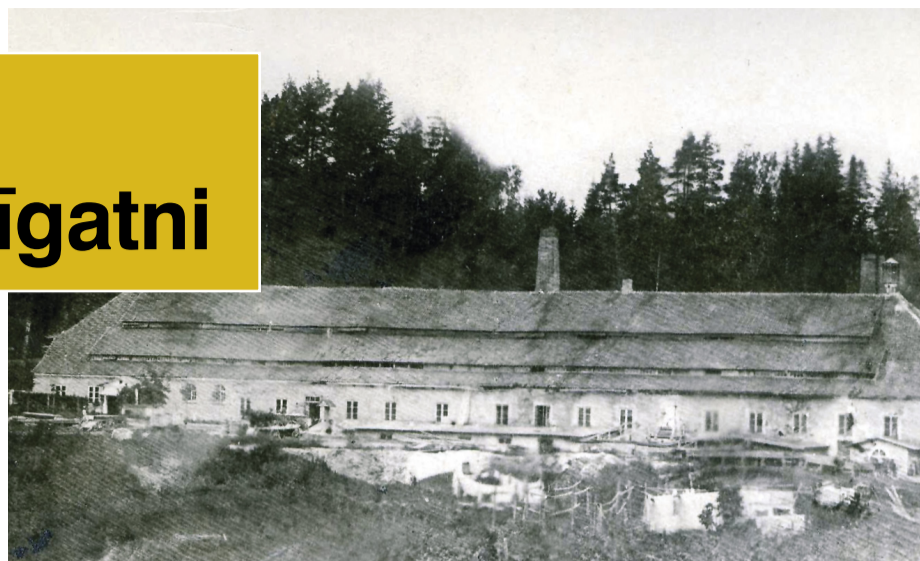
Līgatnes papīrfabrika 1870. gadā pirms lielā ugunsgrēka 1882. gada sākumā.

Līgatnes papīrfabrika ar tās ciematu jeb Līgatnes pilsētu jau kopš