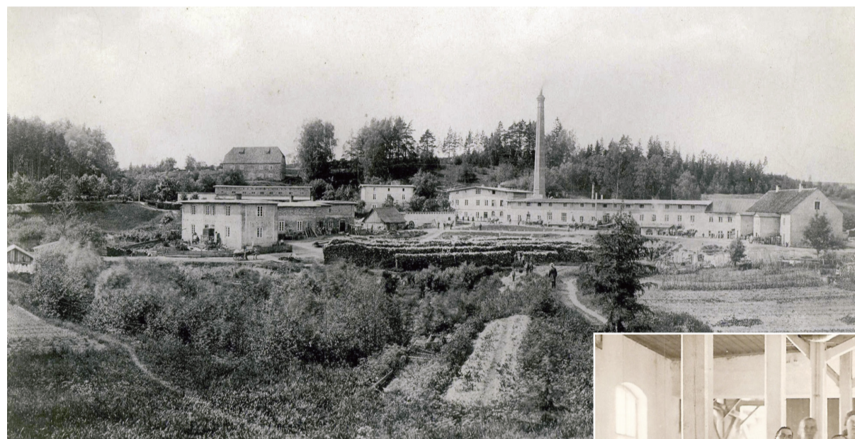
Līgatnes papīrfabrika 1882. gadā pēc atjaunošanas.

seniem laikiem lepojas ar dažādām tradīcijām.