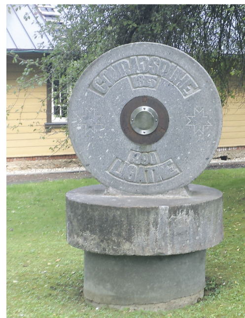
Piemīņas akmens satura pa

Pirms fabrikas degšanas dzīvojam trīsstāvu lielā mājā, kas atradās starp fabriku un vecupi, ar galu pret upi. Gar upes krastu gāja garām ceļš, bet mājas gals ar slēgtu eju bija savienots ar fabriku. Vidus stāvā logs bija līdz grīdai, jo bija ierīkots I un II stāvam vienā laidā. Logs bija nozogots, lai bērni neizdauzītu, un bija istabas vienā un otrā pusē. Katrā loga pusē apmetās viena ģimene. Vecāku gultas parasti pie loga, bet bērnu gultas uz istabas vidu, gulta pie gultas, ka ne cauri iet, ne pagriezties. Tik bija katrai ģimenei iedzīve, kā galdiņš, kāds krēsls un gultas. Vienā istabā bijām 4 – 5 ģimenes. Lai naktī netraucētu miegu, jo bieži naktīs no fabrikas ar petrolejas lampu rokā nāca celt strādniekus uz darbiem un, uzlaizot spilgtu gaismu, izbaidīja cilvēkus, tad viens otrs ierīkoja ap savām gultām aizkarus. Tie jau nebija nekādi aizkari, bet tāpat aizkāra priekšā kādu drēbi, segu vai lakatu. Uz apakšējo stāvu bija jākāpj četras pakāpes uz leju no zemes virsas – tas bija puspagrabā. Apakšas stāvā atradās lielā maizes krāsns, kur visi