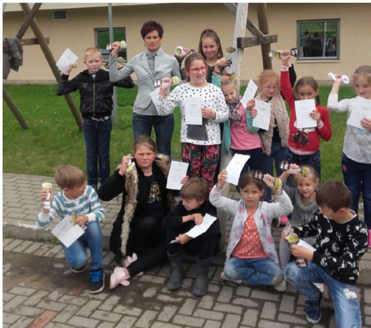
Olimpiskā diena Līgatnes novada vidusskolā.

23. septembrī Līgatnē notika taku skrējieni „Stirnu