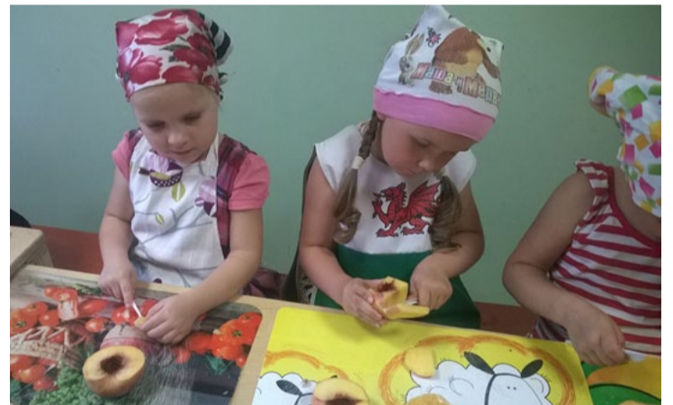
Lapsēnu grupas bērni gatavo augļu salātus.