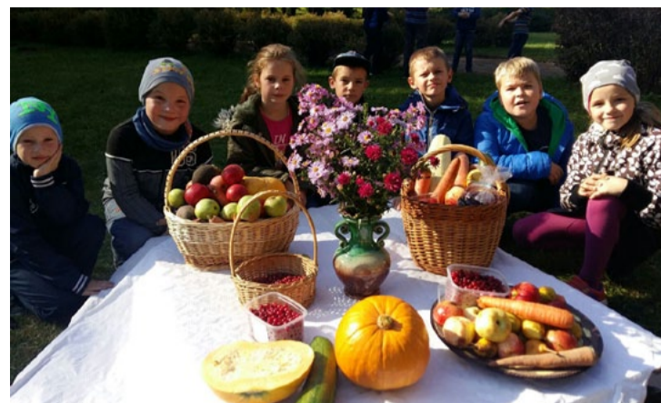
1. a klase Miķeļdienā.

Tradicionāli sākumskolas skolēni veido rudens izstādes. Arī šogad visu uzmanību piesaistīja dažādi dabas mātes un pašu veidoti dārzu vīriņi, mašīnas un pasaku tēli izstādē "Jautrais dārzenis" Augšlīgatnē. Neiztika arī bez Miķeļdienas tirdziņa, kurā netrūka ne pārdevēju, ne pircēju. Visi bija centušies sagatavot savu precī un padomāt par noformējumu. Savukārt Strautu ielā pie