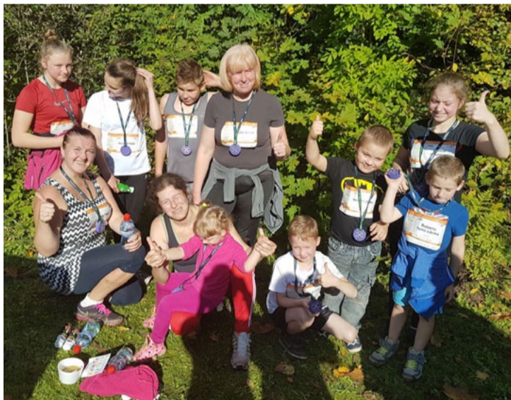
Taku skrējiena „Stirnu buks” dalībnieki pēc finiša.

buks”. Arī mūsu skolēni kopā ar pedagogiem un vecākiem izveidoja savu komandu „Līgatne var” un startēja kopā ar vairāk nekā 3000 dalībniekiem. „Stirnu buks” organizatori deva mums fantastisku iespēju izbaudīt šo jauko pasākumu, kurā mēs piedalījāmies distancē „Vāvere” (6 km) un ļoti interesanti pavadījām laiku.