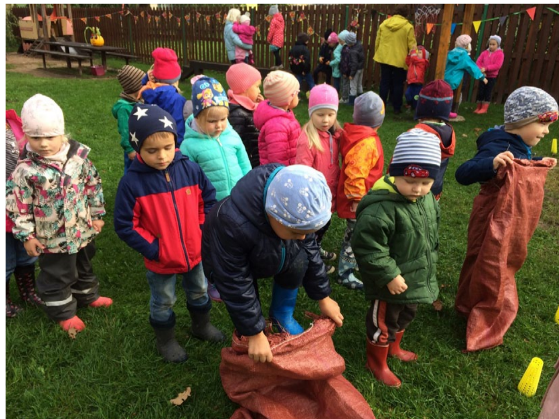
Olimpiskā diena bērnudārzā Augšlīgatnē.