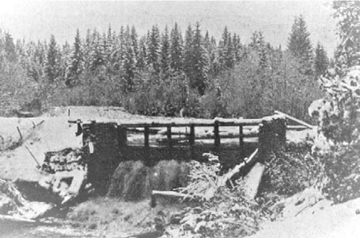
Līgatnes upe pie Nītaures. "Atpūta", Nr. 67 (12.02.1926.).