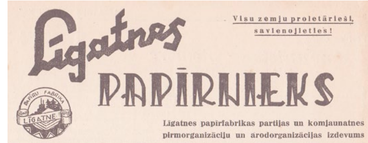
Laikraksta "Līgatnes Papīrnīekas" galvina 1962. gadā.

1882. gada atskaitē par strādniekiem sniedz ziņas par strādājošo vecumu un darba dienas ilgumu. Tai laikā fabrikā strādāja bērni un jaunieši: 3 strādnieki 10 – 12 gadus veci, 17 strādnieki 12 – 15 gadus veci. Prieaugušiem darba dienas garums bija 14 stundas, t. i., no plkst. 5.00 līdz plkst. 19.00; 10 – 15 gadu veciem pusaudžiem bija jāstrādā no plkst.