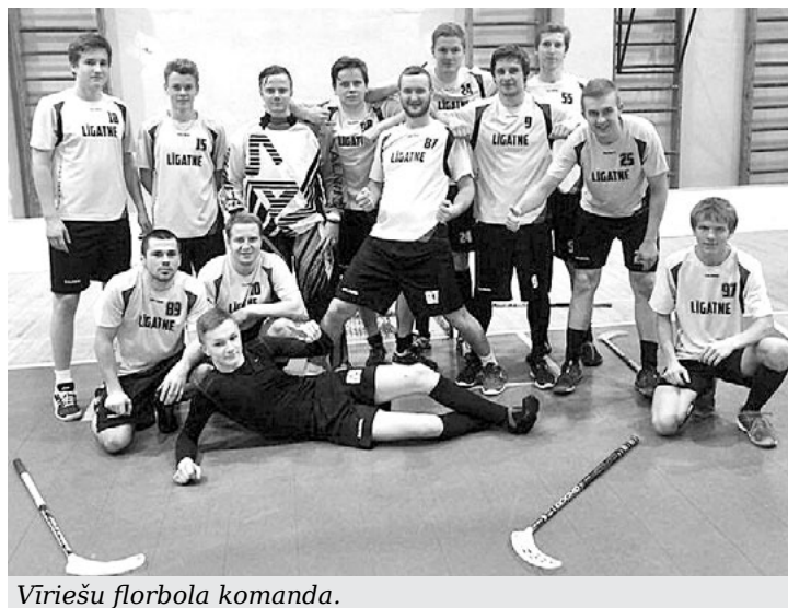
Vīriešu florbola komanda.

3 Līgatnes vīriešu florbola komanda janvārī un februārī ar mainīgām sekmēm turpina dalību Latvijas čempionātā florbolā. Tika zaudētas spēles pret komandām