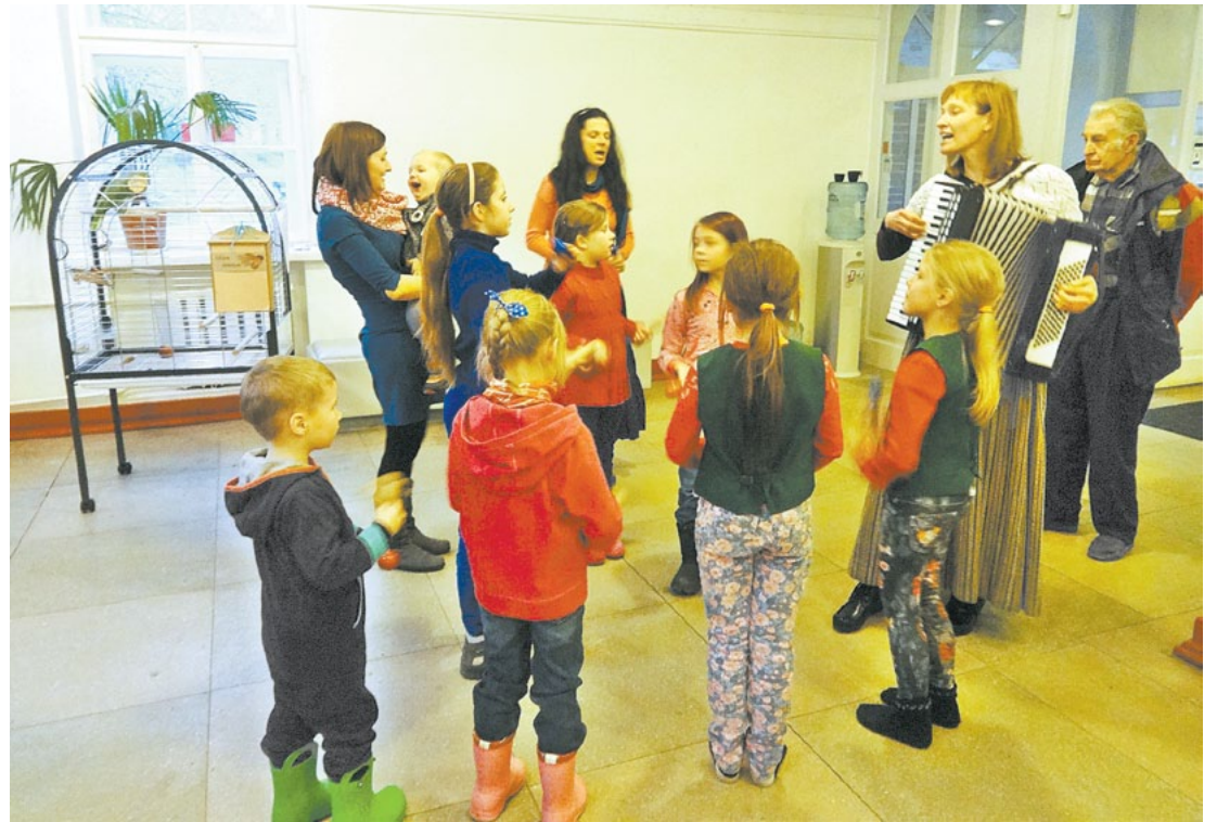
Dienas un amatnieku centra folkloras pulciņa audzēkņi sveic Kešu jaunajās mājās.