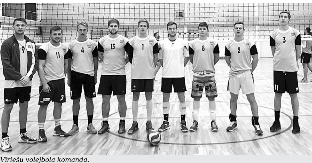
Vīriešu volejbola komanda.

„Rubene” (6:11), „Valmiera” (3:6), bet uzvarētas spēles pret FK „Rīga” (10:9) un komandu „Pēdu nav” (5:4).