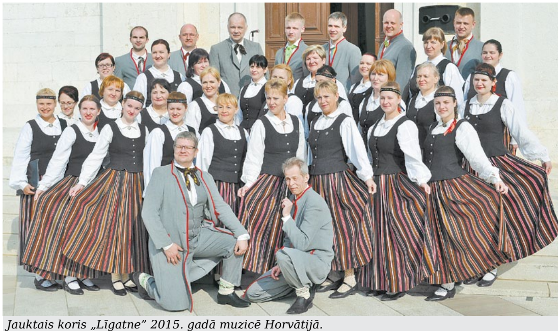
Jauktais koris „Līgatne” 2015. gadā muzicē Horvātijā.

Lai vēlreiz izjustu un atcerētos šo izdziedāto gadu