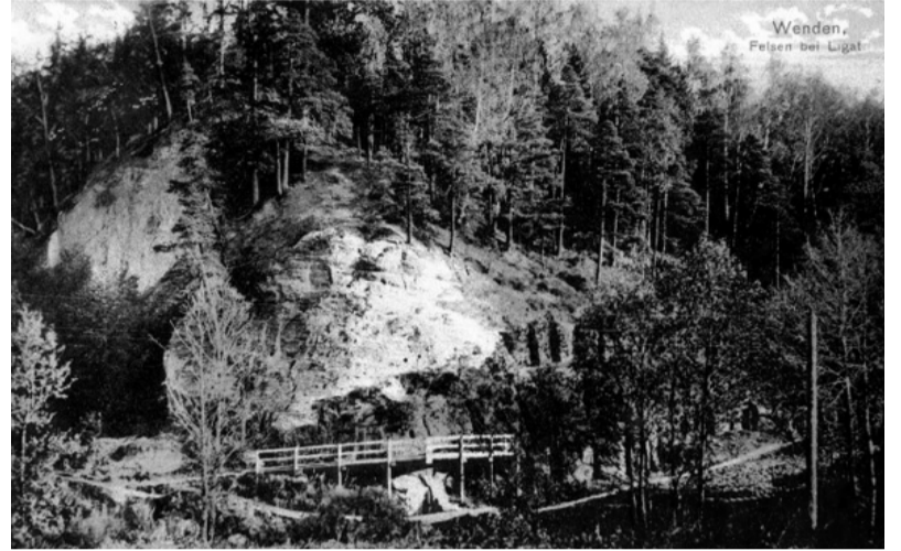
Līgatnes Lustūzis 1907. gadā.

Vēl Līgatnes pagrabu alas ir mēģinājis saskaitīt Ansis Opmanis. Pēc viņa ziņām, esot 150 pagrabu, 13 alu gaņģu (kalnā izcirsta eja un tur iekšā uz abām pusēm izveidoti pagrabi) ar 170 pagrabiem un 5 pazemes garāžas.